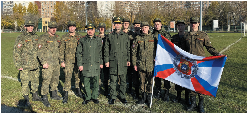
Сборная ВУЦ при МГМСУ им. А.И. Евдокимова