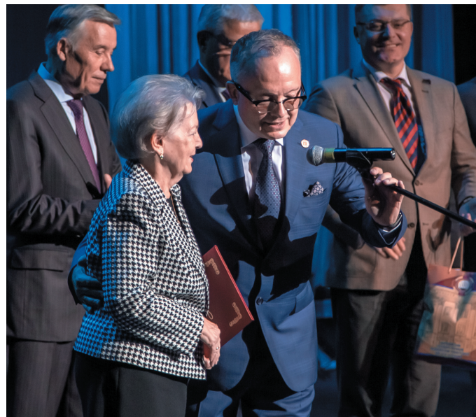
Президент РМАНПО Л.К. Мошетова выступает от имени представителей вузовского сообщества