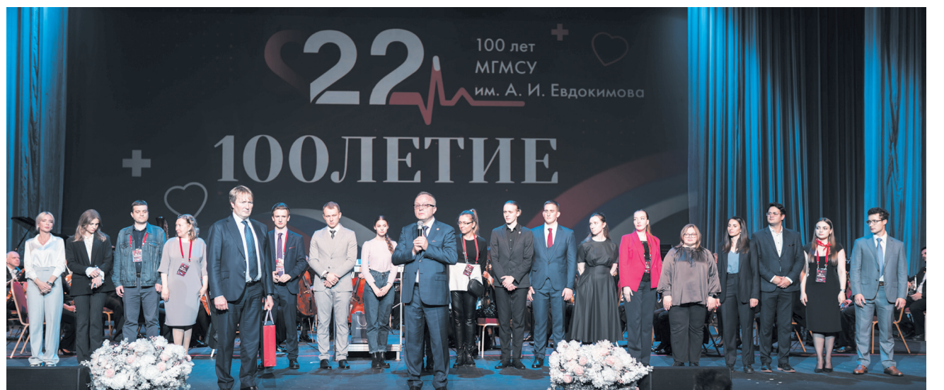
Зал и ректор приветствуют организаторов юбилейного мероприятия