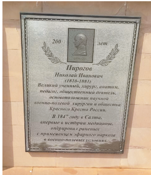
Памятная доска, посвященная Н.И. Пирогову