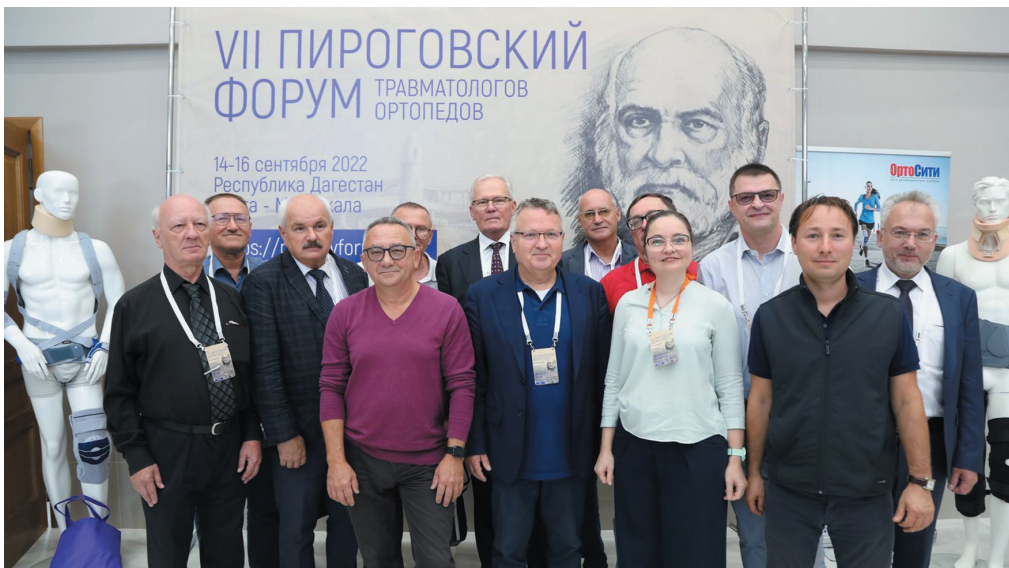
Ведущие травматологи-ортопеды России