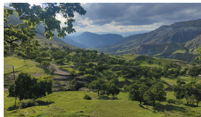
Окрестности села Салта, Губинский р-н, Дагестан