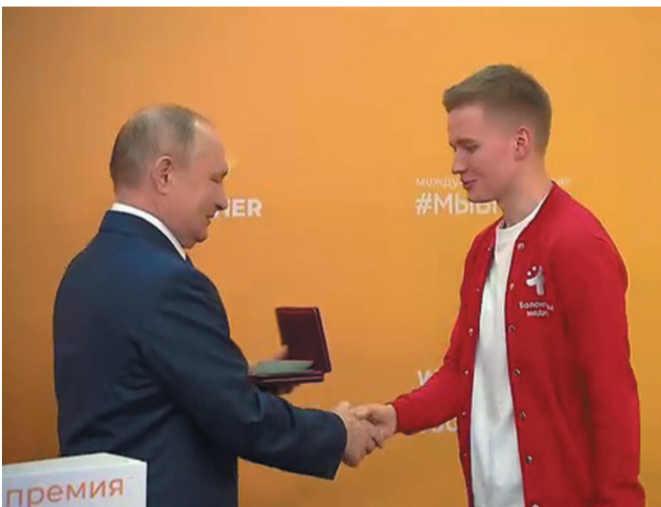
Медаль Луки Крымского вручается Президентом В.В. Путиным В. Никольскому