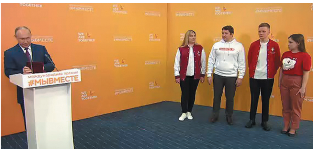
Президент России В.В. Путин вручил медали Луки Крымского номинантам премии "Волонтер года - 2021" Ольге Золотухиной, Павлу Бережанскому, Владимиру Никольскому и Екатерине Садаковой

5 декабря 2021 г. получил медаль Луки Крымского из рук Президента РФ В.В. Путина.