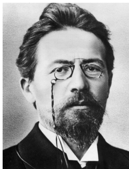
Антон Павлович Чехов (1860–1904)