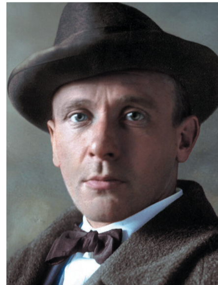
Михаил Афанасьевич Булгаков (1891–1940)