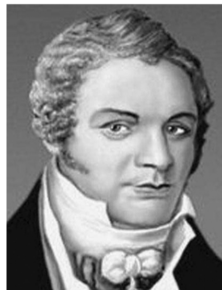
Матвей Яковлевич Мудров (1776–1831)