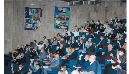
Утверждение Коллективного договора на 2020–2023 гг.