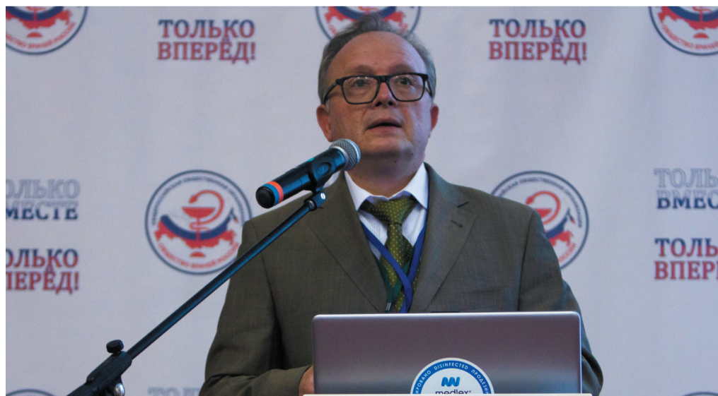
Выступает президент Общества врачей России, академик О.О. Янушевич

2020 гг. и задачах на период до 2025 г. выступил президент Общества, академик О.О. Янушевич. Был заслушан отчет контрольно-ревизионной комиссии. По итогам обсуждения делегаты съезда признали работу Общества врачей России и его руководящих органов удовлетворительной. Съезд определил задачи Общества врачей России на ближайшие 5 лет – организационное развитие, представление интересов врачебного сообщества в органах государственной власти, участие в формировании эффективной системы здравоохранения, реализации Национального проекта «Здравоохранение», экспертная деятельность, правовая защита врачей, участие в системе непрерывного медицинского образования, в аккредитации врачей, разработке новых и актуализации продолжение на с. 2