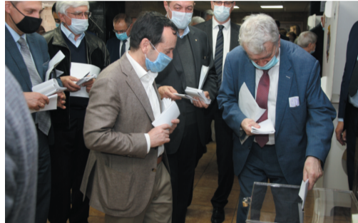
Идет тайное голосование по кандидатурам в члены Ученого Совета