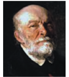
Портрет Н.И. Пирогова кисти И.Е. Репина

1833 г. Пирогову была присвоена ученая степень доктора медицины, в 1836 г. он был избран профессором теоретической и практической хирургии в Императорском Дерптском университете, а еще через десять лет стал членом-корреспондентом Петербургской академии наук.