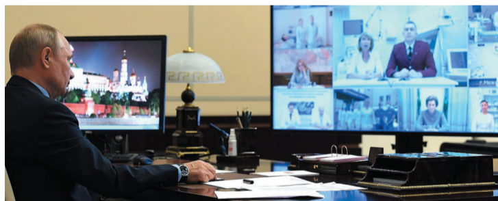
Президент В.В. Путин проводит совещание с медицинскими работниками в режиме видеосвязи 20 июня 2020 г.

Н.И. Пирогов считается основоположником военно-полевой хирургии, а также одним из основоположников хирургии как научной медицинской дисциплины. Именно Н.И. Пироговым впервые в мире был применен наркоз в военно-полевой обстановке; это произошло в ходе Салтинского сражения в 1847 г. В годы Крымской войны Н.И. Пирогов являлся главным хирургом Севастополя, который в течение 11 месяцев находился на осадном положении; в последующие годы в качестве консультанта он также находился на фронтах франко-прусской войны 1870–1871 гг. и русско-турецкой войны 1877–1878 гг. В 1854 г., оперируя раненых участников обороны Севастополя, Н.И. Пирогов впервые в истории русской медицины применил неподвижную гипсовую повязку в военно-полевых условиях. В своих работах ученый также отмечал важность профилактической медицины, единства лечения и эвакуации раненых, а также их сортировки. Скончался Н.И. Пирогов 23 ноября [5 декабря] 1881 г. Его именем назван ряд медицинских учреждений, в частности, Российский национальный исследовательский медицинский университет.