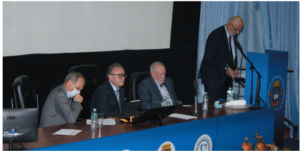
В президиуме конференции

После обсуждения делегаты конференции единогласно приняли Коллективный договор работников МГМСУ на 2020–2023 гг.