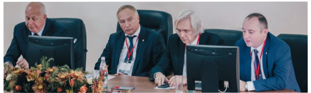
В президиуме конференции