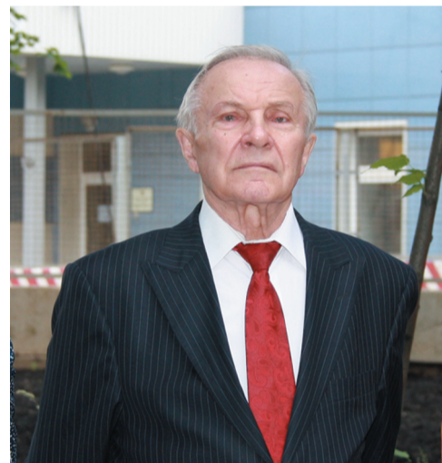
Э.В. Луцевич (1928–2016)

Мемориальная лекция "Э.В. Луцевич — выдающийся российский" продолжение на с. 2