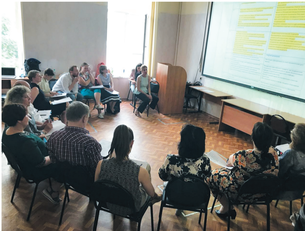
Работа группы специалистов по теме «Имплементация психологии в медицину»

Современная концепция медицины предполагает активное развитие социальных служб. В составе комиссии по медико-социальной экспертизе обязательно есть психолог, который наряду с врачами разного профиля определяет реабилитационный потенциал пациента и контролирует его реализацию. Специалисты по социальной работе оказывают всестороннюю поддержку нуждающимся в помощи людям – от психологической помощи до консультаций по вопросам прохождения медико-социальной экспертизы и полноценного включения инвалидов и людей с ограниченными воз-