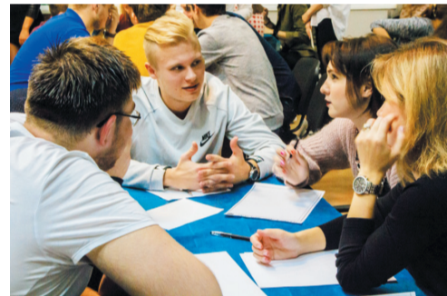
Участники в игре