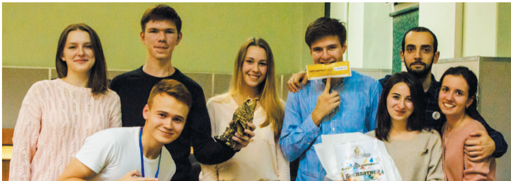
Победители игры: команда "Братва"