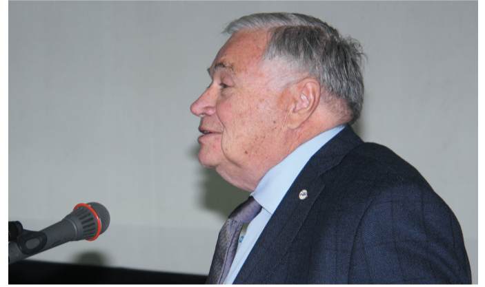
Президент Российского общества хирургов, академик РАН И.И. Затевахин