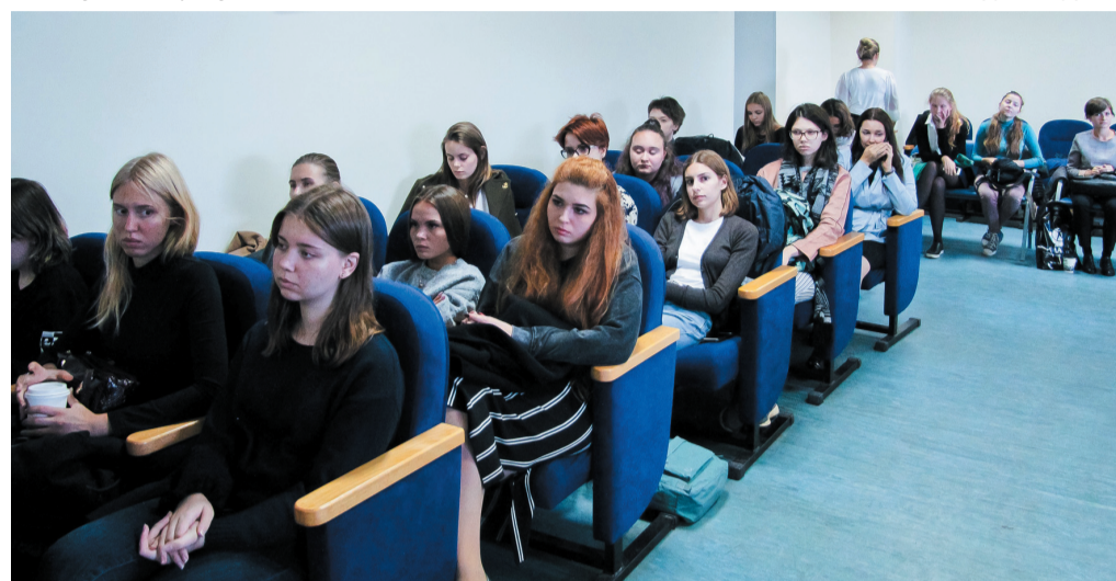
Студенты МГМСУ среди слушателей докладов молодых ученых