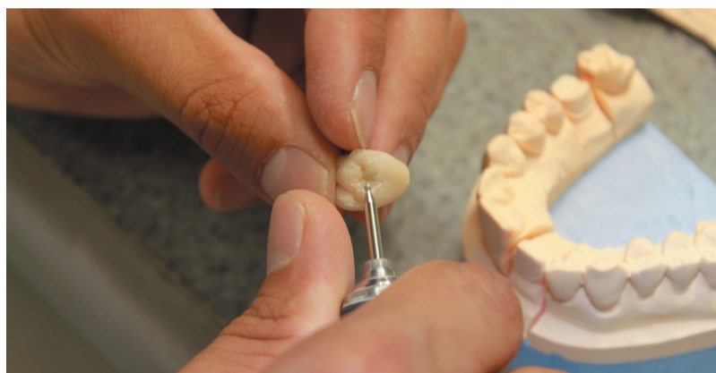
Выполнение заданий конкурса

Это профессиональное состязание было организовано с целью беспристрастной оценки уровня мастерства всех участников и направлено на выявление молодых и перспективных мастеров зуботехнического дела.