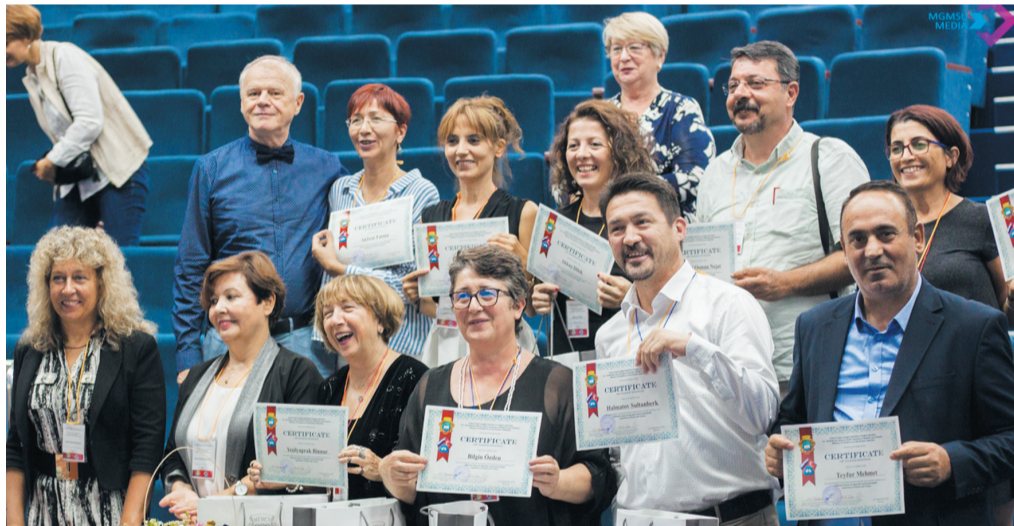
Сертификаты об участии вручены гостям из Турции