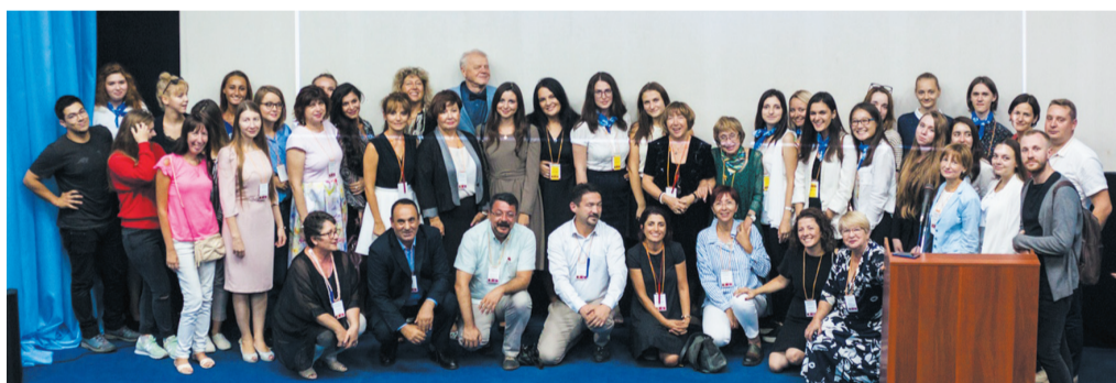
Участники, организаторы и гости конференции