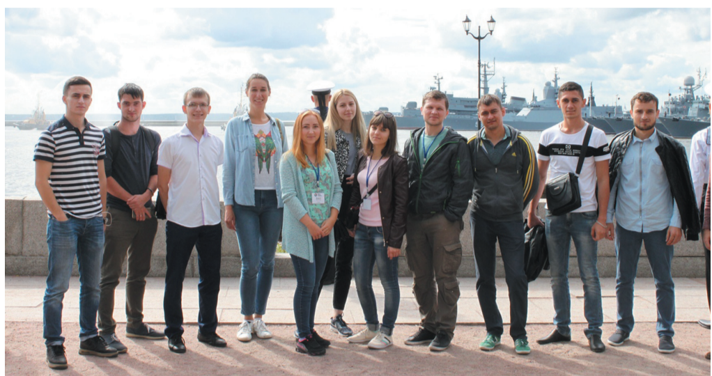
Участники финала на экскурсии в Кронштадте

На следующий день состоялся еще один конкурс, который заключался в моделировании 21, 22, 23 зубов. Для создания необходимой модели всем участникам понадобились моделировочный шпатель, электрошпатель и воск.