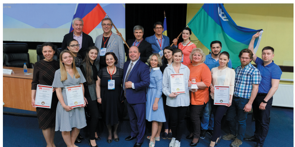
Члены жюри и участники Чемпионата