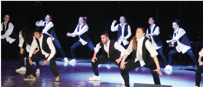
Участники танцевального коллектива "Mix dance" (руководитель — Х. Челидзе)