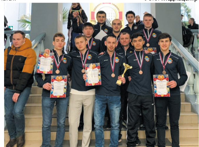
Сборная команда МГМСУ по мини-футболу