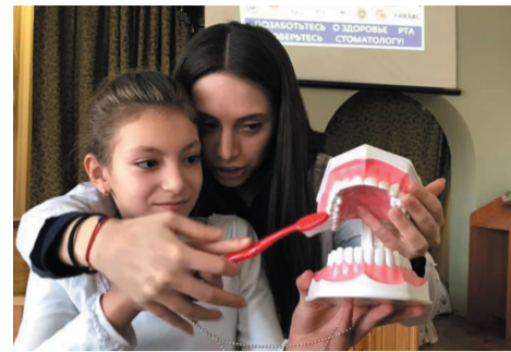
Сотрудники кафедры детской стоматологии обучают учеников школы № 9 г. Красногорска индивидуальной чистке зубов