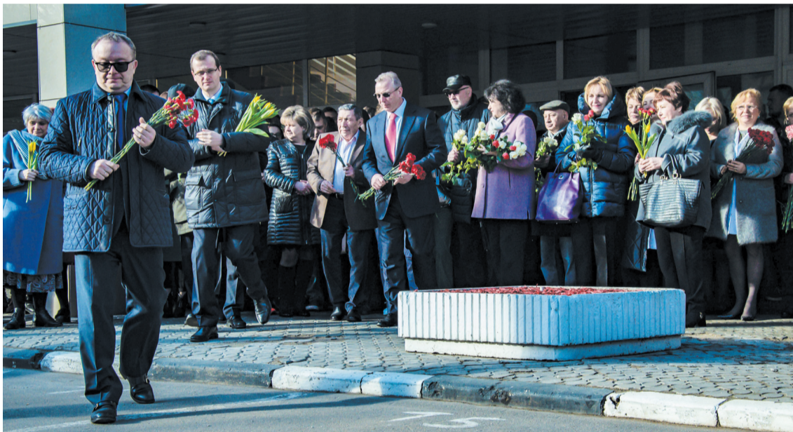
Возложение цветов к памятнику А.И. Евдокимову