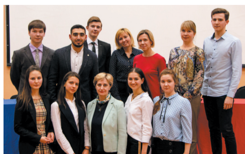
Финалисты и члены жюри