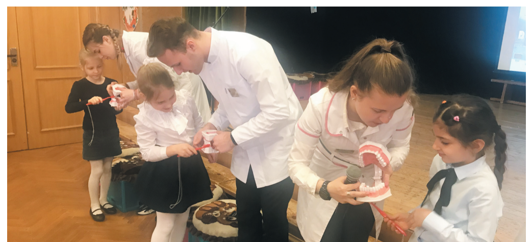
Урок гигиены полости рта в московской школе № 1950 проводят ординаторы кафедры профилактики стоматологических заболеваний